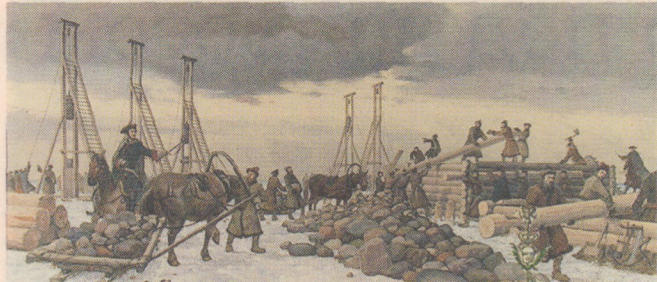
АНДРЕЙ ТРОНЬ «СТРОИТЕЛЬСТВО ФОРТА КРОНШЛОТ». ЦЕНТРАЛЬНЫЙ ВОЕННО-МОРСКОЙ МУЗЕЙ