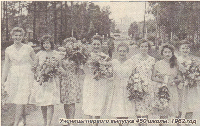
Ученицы первого выпуска 450 школы. 1962 год