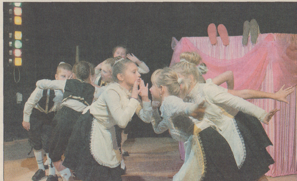
«Баллада о королевском бутерброде»