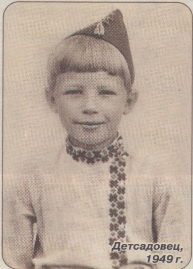
Детсадовец, 1949 г.

Руководство и сотрудники СПб ГБУЗ «Городская больница №40» Служащие отдела здравоохранения администрации Курортного района СПб