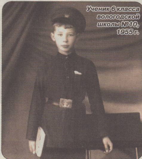
Ученик 6 класса вологдской школы №10, 1955 г.