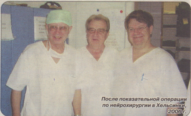
После показательной операции по нейрохирургии в Хельсинки, 2006 г.