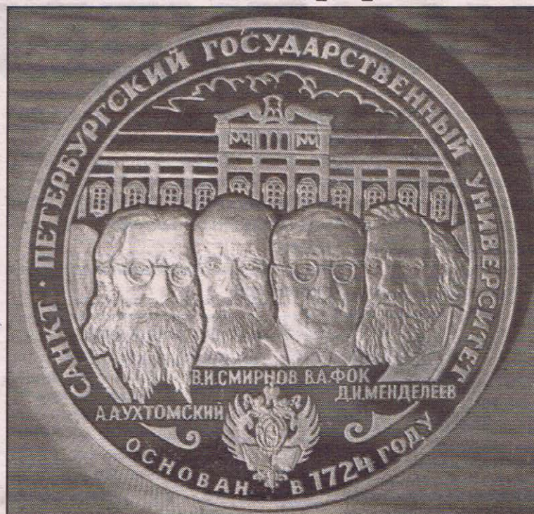
Ученые Санкт-Петербургского Университета, изображенные на юбилейной медали к его 275-летию: А.А.Ухтомский, В.И.Смирнов, Д.И.Менделеев, В.А.Фок.

Он академик, математик, резко отличается от крупных ученых подобного чина знаниями и в чуждых как будто бы областях. Володя Орлов его встретил на пароходе и познакомился. Кто-то сказал ему,