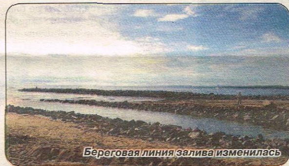
Береговая линия залива изменилась