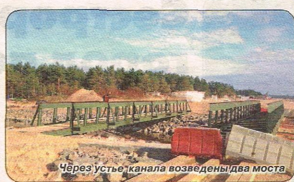
Через устье канала возведены два моста