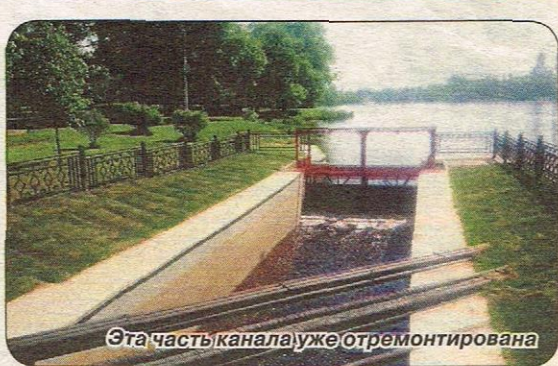
Эта часть канала уже отремонтирована