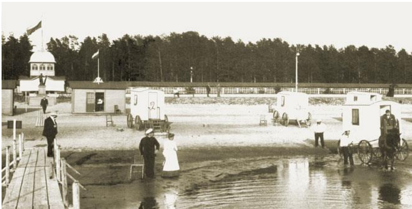
Вдоль берега шла застекленная со стороны залива галерея, где гуляли в ненастную погоду. В центре эспланады стоял памятник Петру I

В начале XX века Сестрорецкий курорт был самым фешенебельным местом на побережье. Музыканты, писатели, актеры и прочие творческие работники переберутся в Репино и Комарово лишь тогда, когда от старого курорта почти ничего не останется.