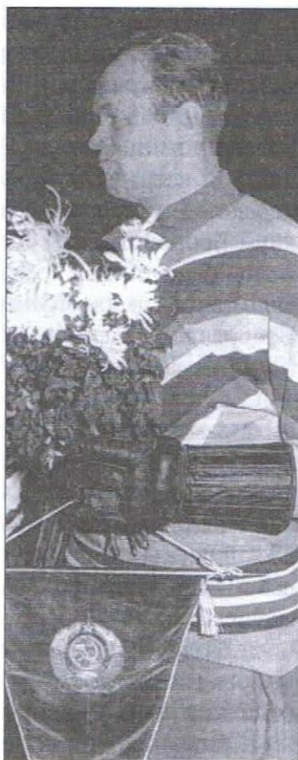
Букет и вымпел от команды учеников побежденной команде учителей

О спортивном уникале Боброве лучше других сказал когда-то футбольный тренер армейской команды Борис Аркадьев: «Совершенная человеческая конструкция, идеал двигательных навыков, чудо мышечной координации».