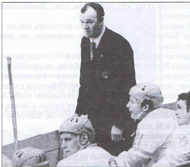
Старший тренер сборной СССР и его подопечные

Между тем вскоре тренер блистательной сборной был отправлен в отставку. Об этом позаботился главный хоккейный начальник страны Валентин Сыч из Спорткомитета СССР, никогда не игравший в хоккей.