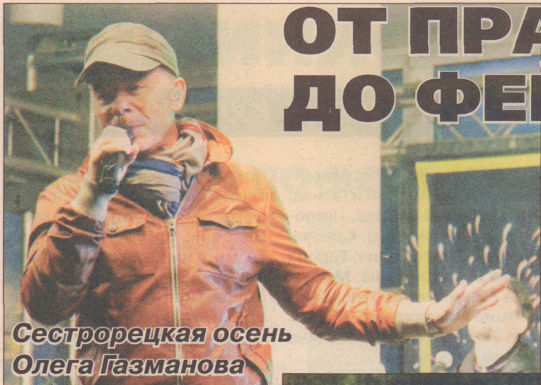
Сестрорецкая осень Олега Газманова

На летней эстраде парка своими выступлениями радовали горожан такие творческие коллективы города, как хор «Русская песня», образцовый ансамбль русской песни «Жемчуга», «Magic – dance», а также артисты эстрады Санкт-Петербурга. Гвоздем программы здесь был Андрей Разин и группа «Ласковый май».