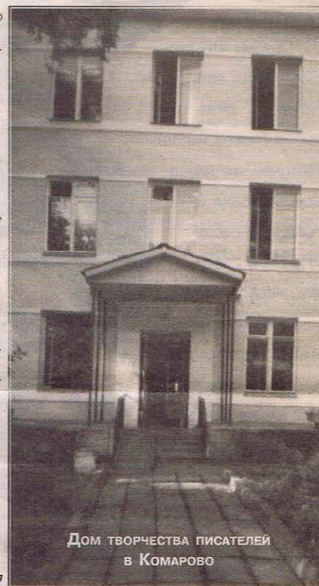
Дом творчества писателей в Комарово