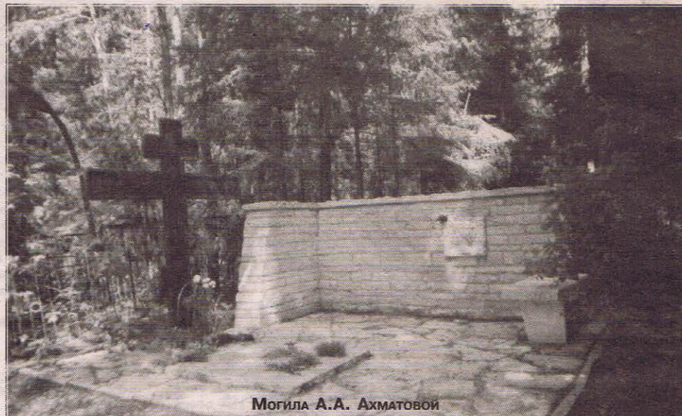
Могила А.А. Ахматовой

Восемнадцать лет истории Комарово связаны с именем