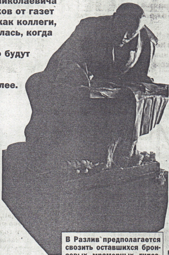
В Разливе предполагается свозить оставшихся бронзовых, мраморных, гипсовых и т. д. ильичей.