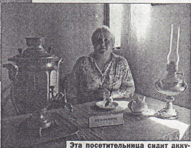
Эта посетительница сидит аккуратно в том месте, где Владимир Ильич чаек попил.