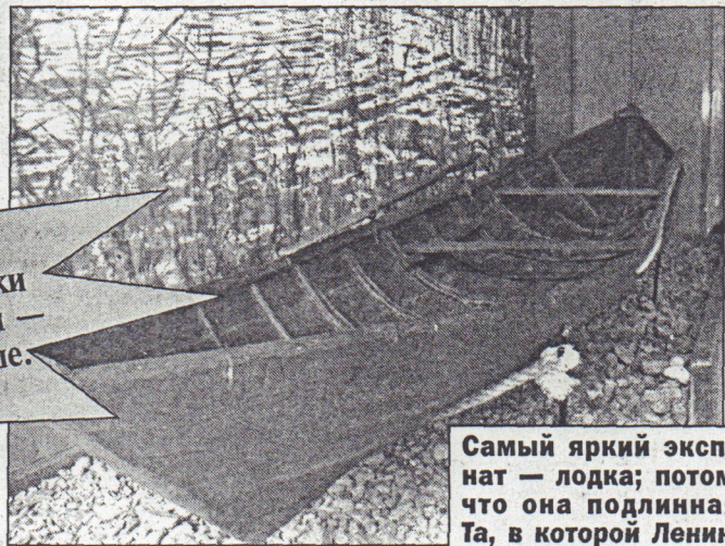
Самый яркий экспонат — лодка; потому что она подлинная. Та, в которой Ленина перевозили.

Сегодня посещаемость музея — 1600 — 1800 человек в месяц в летний период. Правда, до перестройки только в Шалаш приезжало и 550 тысяч в год. Но тогда и страна была побольше.