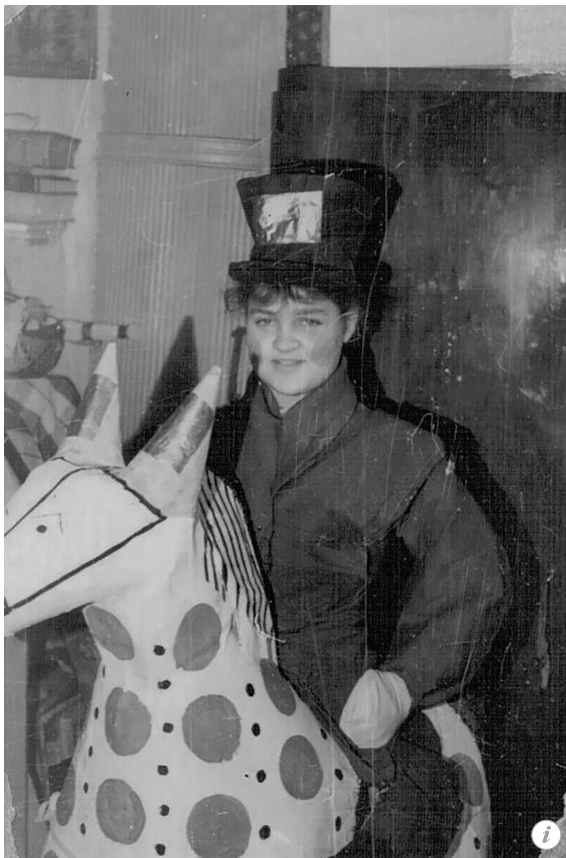
На праздники к Васнецовым было принято неистово наряжаться в маскарадные костюмы, например, дымковской игрушкой

У нас сохранился большой архив, хотя дед никогда не писал воспоминаний. За ним все рассказы потихоньку на всяких листочках записывала бабушка. Кстати, сначала она была женой Владимира Лебедева (именно его стараниями в качестве главы художественной редакции детского отдела Госиздата над иллюстрациями к книгам работали лучшие авторы страны, к которым относился и сам Лебедев, выдающийся художник и график. — Прим. ред.). Бабушка с дедушкой познакомились в культурной пивной. «Детгиз» располагался в Доме книги, там бабушка какое-то время работала машинисткой. Рядом на канале Грибоедова была пивная, куда ходили после зарплаты детские писатели и художники. Их познакомили общие друзья, дед был страшно робким. Есть смешная история, как Лебедев не принял какие-то рисунки Васнецова, а тот прибежал домой и сказал: «Галька, не будем жениться!» Но потом как-то нашли на что справить свадьбу.