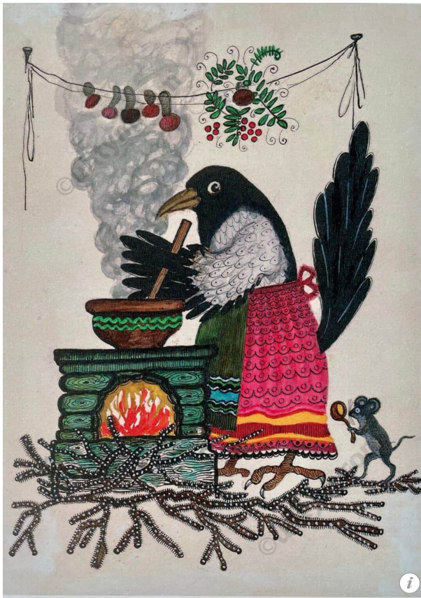
Иллюстрация «Сорока-белобока» Юрия Васнецова для сборника русских народных песен (1958)