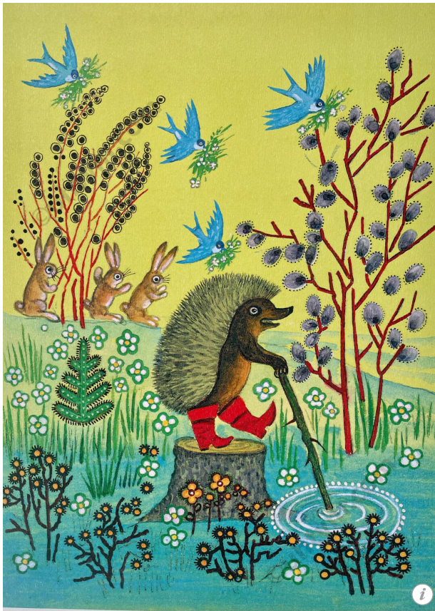
Иллюстрация «Еж» Юрия Васнецова для сборника песенок, потешек и прибауток «Радуга-дуга»

Дедушка создал собственный визуальный язык. И я мечтаю сделать васнецовский парк аттракционов по принципу музея скандинавских сказок Юнибакен в Стокгольме: представляете, норка мышонка, куда можно было бы забраться и все потрогать! Еще я бы хотела открыть музей с детской творческой театральной и художественной студией при нем. Вообще было бы здорово, чтобы все аттракционы нарисовали дети — я уже проводила конкурс «Сказка Васнецова в современном городе» и очень впечатлена качеством присланных работ. Дедушку, кстати, очень интересовал дизайн общественных пространств, он даже рисовал вывески — эту линию мне кажется логичным продолжать. Представляете: городской экскурсионный маршрут по необычным детским вывескам, например, Петроградской стороны!