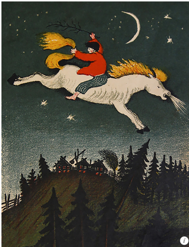
Иллюстрация «Конек-Горбунок» Юрия Васнецова

С этого издания и началась удачная карьера дедушки. Были и сложности: «Путаница» Корнея Чуковского была разругана в рамках борьбы с формализмом, а «Конька-Горбунка», настоящее произведение искусства, ненапечатанным счистили с типографских камней: мол, мазня, советским детям такое не надо, все это пугает и вообще ни на что не похоже. Прикладными вещами дед тоже занимался, например, ЛФЗ выпустили тиражные детские фарфоровые сервизы с его рисунками, сейчас многие ищут их по антикварным лавкам, вот моя подруга недавно купила тарелку с Сорокой-белобокой.