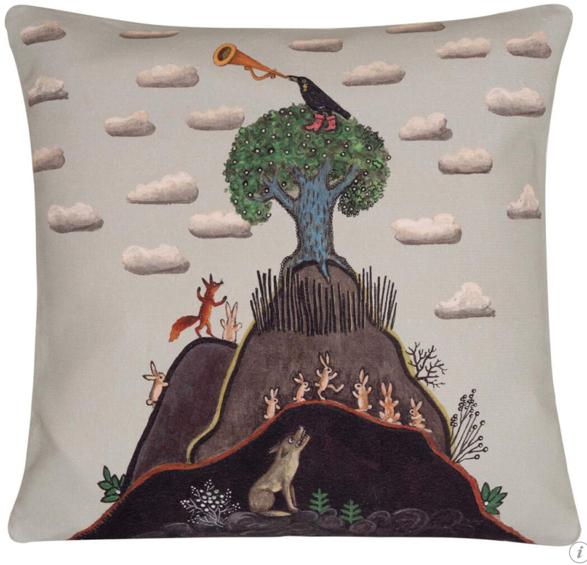
Чехол для подушки «Ворон на дубу»