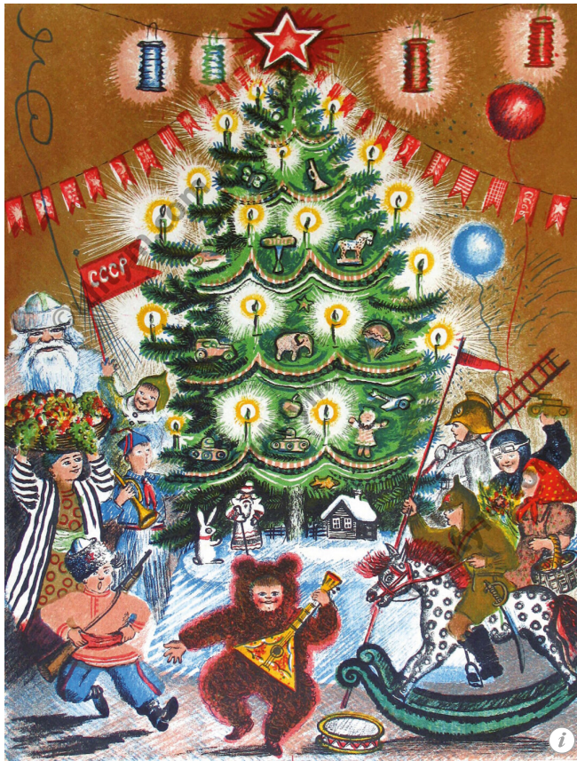
Новогодняя открытка с рисунком Васнецова передает реальную атмосферу на маскарадных вечерах семьи

Мне бы хотелось возродить и эту традицию тоже. На 80-летие мамы я устроила демонстрацию мод. Нашла на даче платья, которые шила бабушка, они хорошо сохранились, материалы-то были прекрасные. И мои дочери стали моделями. Младшей досталось платье из шелка: помню, как мама подарила папе на день рождения себя в этом платье. А в финале невестой вышла средняя Варя, беременная на восьмом месяце. На экране в это время показывали фото мамы в этих нарядах, а я комментировала показ, как раньше делали в парижских модных домах. Мы и сейчас стараемся регулярно собираться все вместе, хотя члены нашей семьи разбросаны по миру — от Австралии до Марокко.