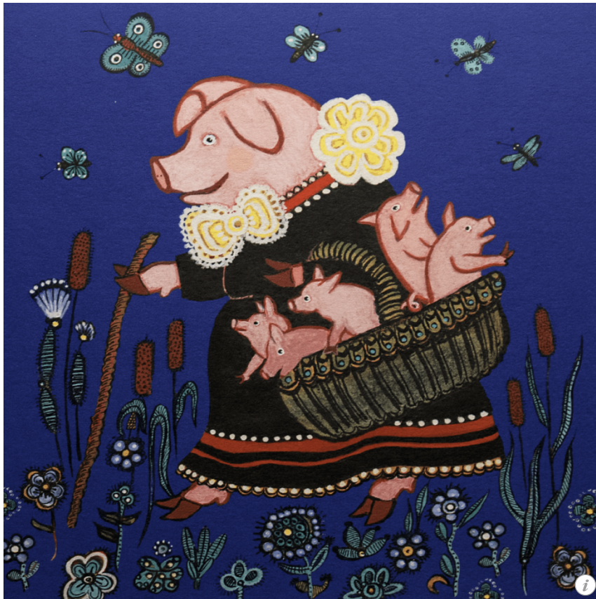
Открытка «Свинка с поросятами»