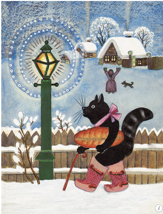
Иллюстрация «Кот» Юрия Васнецова из потешки «Пошел котик на торжок»