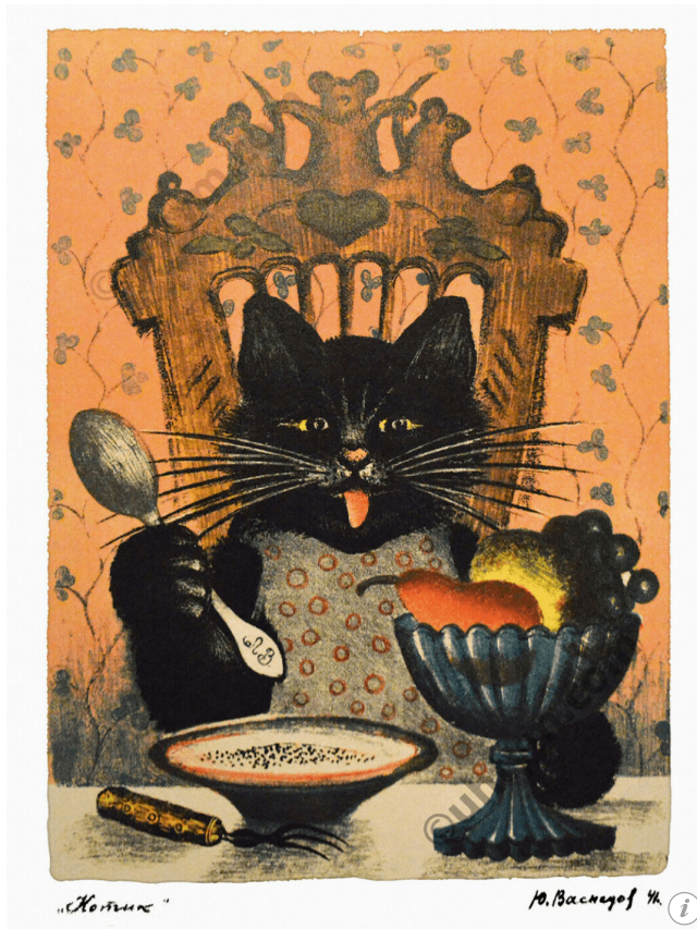
Иллюстрация Юрия Васнецова для книги «Кот-воркот», 1948

по политическим причинам и работал врачом по распределению. В итоге папин отец родился в Италии. Потом свершилась революция, и эти сумасшедшие люди вернулись в Россию. В 1937 году прапрадед, который жил в знаменитом Доме политкаторжан на Троицкой площади, был арестован и умер в тюрьме от воспаления легких, ему было уже за 90. Одним словом, интересная семья!