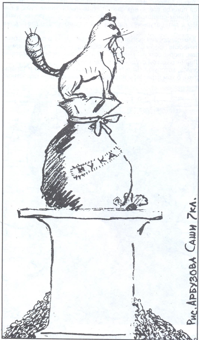
Рис. АРБУЗОВА Саша 7кл.

На уроках рисования в нашем санатории мы решили разработать проекты памятника блокадному коту. При этом мы исходили из того, что его образ должен решаться не в виде